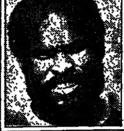
اجمل اصابة لرفعت ترك من بعد ٤٥ م